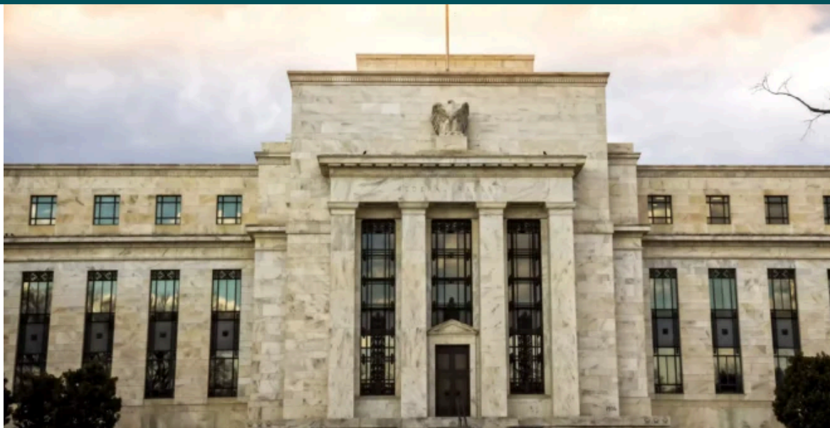
Federal Reserve, o Banco Central dos Estados Unidos